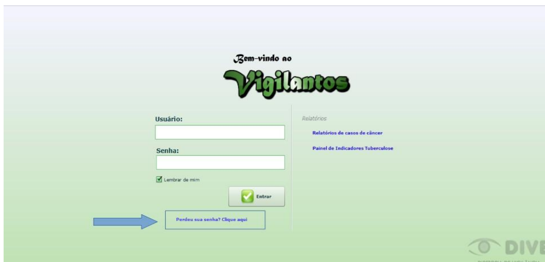
Figura 1: Recuperação de Senha

Os dados serão enviados para o setor responsável pela confecção das senhas e o solicitante receberá, por e-mail, um nome de usuário e uma senha padrão que deverá ser alterada no primeiro acesso. Caso o usuário esqueça a senha é possível alterá-la no local indicado na Figura 1. É requerida a digitação do nome de usuário e, após clicar em “Recuperar Senha” será enviado uma mensagem para o e-mail cadastrado no sistema com orientações para troca de senha.