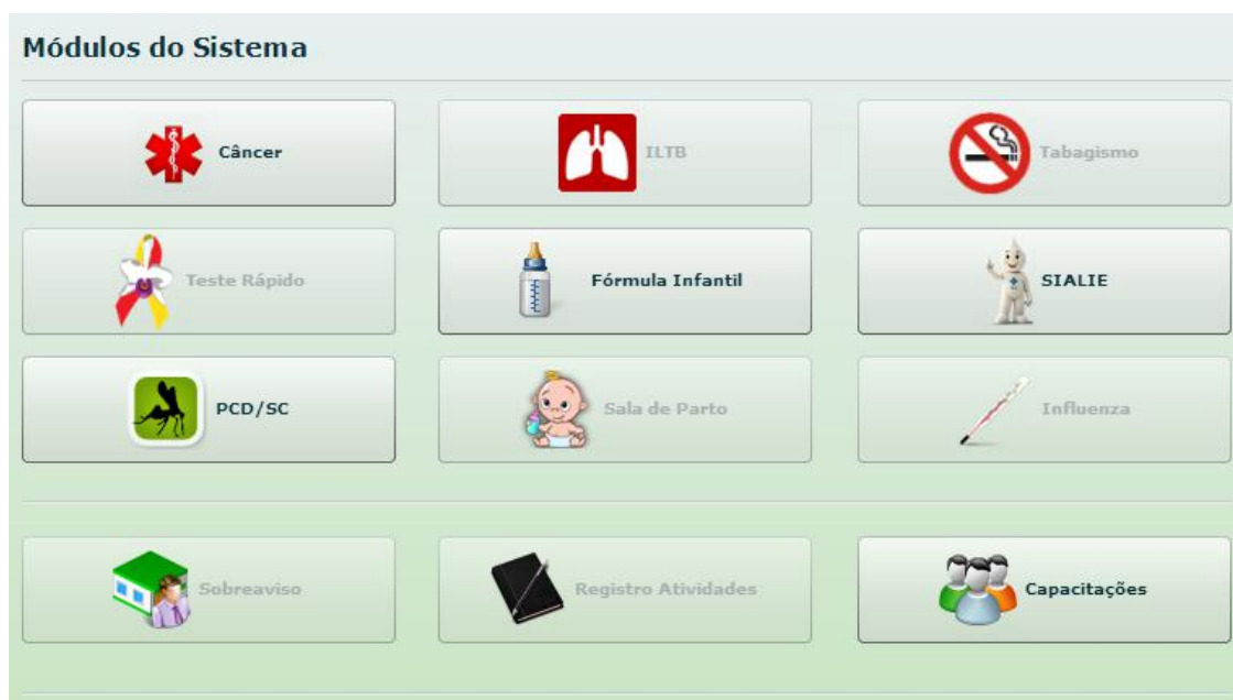
Figura 3.1: Página inicial do sistema Vigilantos com os módulos disponíveis