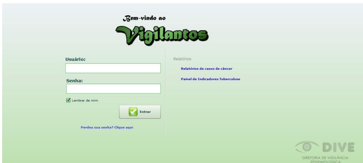
Figura 3: Página inicial do sistema Vigilantes.

Na página inicial será necessário preencher os campos mostrados na Figura 3 com o nome de usuário e senha.